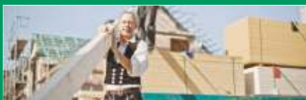
Bauen mit Holz