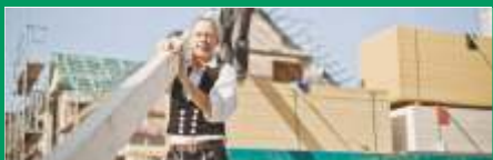
Bauen mit Holz