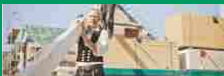
Bauen mit Holz