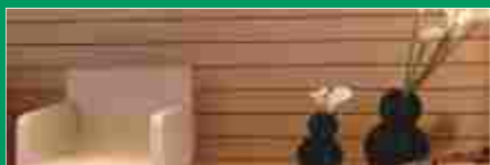
Wand & Decke