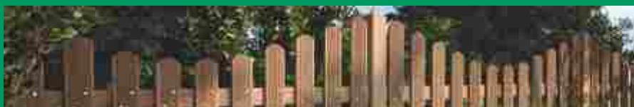
Holz im Garten

Holzland Woll GmbH & Co. KG Wohnlichstr. 10 75179 Pforzheim Industriegebiet Brötzingen Tal