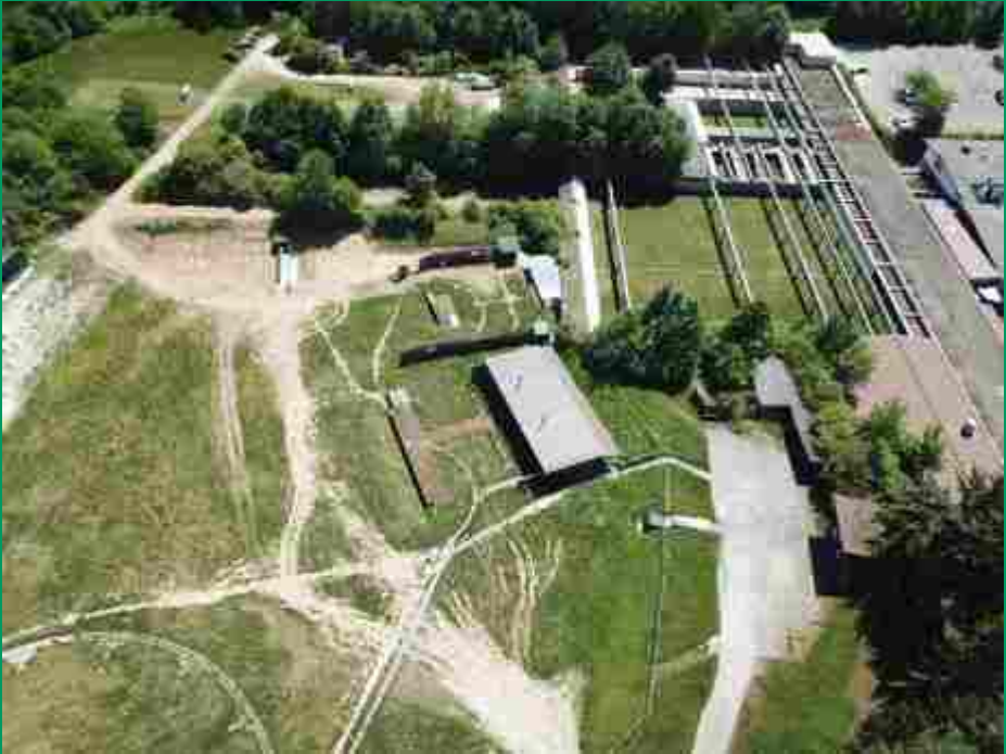
Unsere Baustelle von oben.