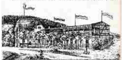
SCHÜTZENHAUS AUF DEM ROD 1897-1910