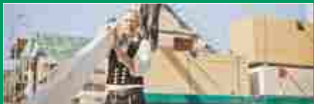
Bauen mit Holz