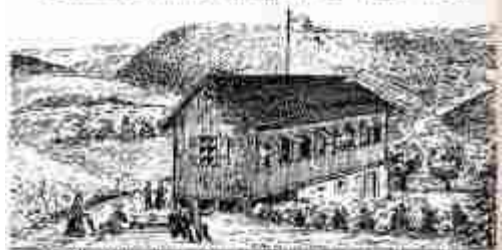
SCHÜTZENHAUS AUF DER SCHANZ 1868-1876