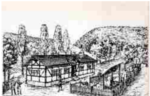
SCHÜTZENHAUS A. D. BLEICHE 1808-1867

Ein Glückshafen beim Armbrustschießen. Die erste Kunde über ein Armbrustschießen in unserer Stadt gibt uns eine handschriftliche Einladung an „die strengen, fürsichtigen und weisen Meister und Räte der Stadt Straßburg und gemeinlich die Schießgesellen da selbst“. Sie ging aus vom „Rate, Schultheiß und gemeinlich den Schießgesellen der Stadt Pforzheim“ mit Verwilligung und Gunst des Markgrafen Karl I. Die-ses Schießen „mit dem Armbrust“ war ausgeschrieben auf St. Johannistag 1471. Die Schießpreise bewegten sich „von 31 „guldin“ abwärts bis ein „guldin“. Außerdem war mit dem Schießen ein „Glückshafen“ d. h. eine Lotterie