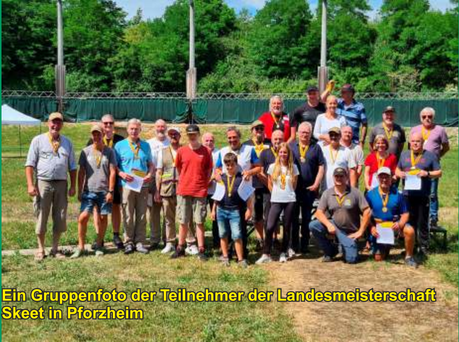
Ein Gruppenfoto der Teilnehmer der Landesmeisterschaft Skeet in Pforzheim