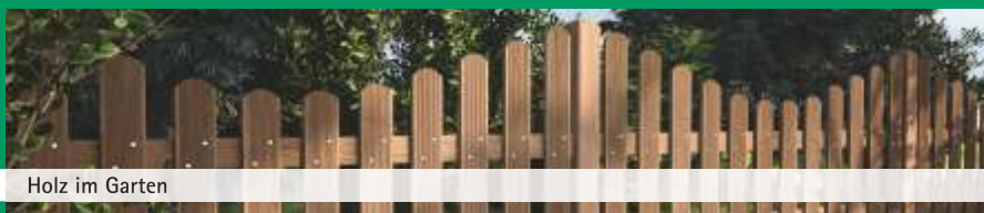
Holz im Garten

Holzland Woll GmbH & Co. KG Wohnlichstr. 10 75179 Pforzheim Industriegebiet Brötzingen Tal