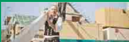
Bauen mit Holz