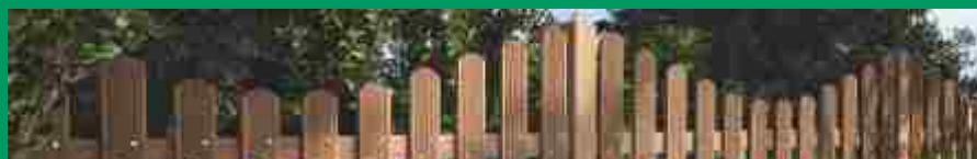
Holz im Garten

Holzland Woll GmbH & Co. KG Wohnlichstr. 10 75179 Pforzheim Industriegebiet Brötzingen Tal