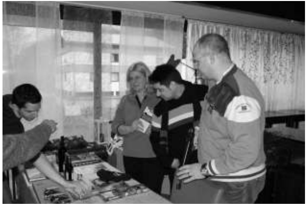
Wer darf sich zuerst am Sponsorentisch bedienen?