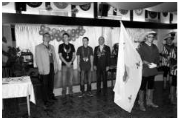
Ein Abschiedsbild: Die Könige vom letzten Jahr müssen ihre Ketten wieder abgeben und erhalten ersatzweise eine Erinnerungsmedaille

Einen breiten Raum nahmen zum Abschluß die vielen Vereinsmeister in den verschiedenen Disziplinen und Starterklassen ein. Die Teilnahme an der Vereinsmeisterschaft ist wiederum Voraussetzung, um an weiterführenden Meisterschaften, wie der Kreis- und der Landesmeisterschaft oder sogar der Deutschen Meisterschaft teilnehmen zu können.