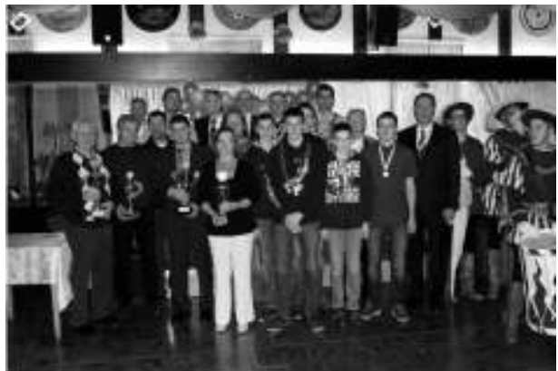
Könige, Ritter, Pokalgewinner und Teilnehmer an DM und WM