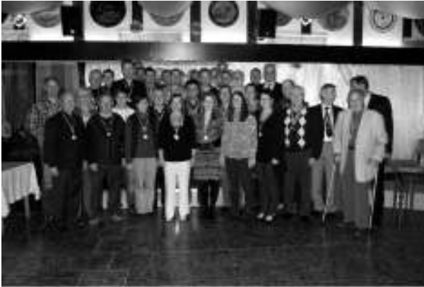
Des sen die wo gwonne hen. Deutscher Untertitel: Die Vereinsmeister 2013

Wenn es etwas ruhiger wird und die großen Wettkämpfe des Jahres abgeschlossen sind, ehrt die Schützengesellschaft Pforzheim 1450 e.V. ihre Sieger und sonstige verdienstvolle Persönlichkeiten.