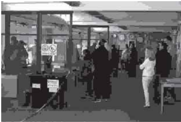
Die Halle(n) war(en) voll, nicht nur weil...

Am Fronleichnamstag hatte die Schützengesellschaft wieder Tür und Tor geöffnet für interessierte Besucher. Weil das Wetter nicht ganz gut und nicht ganz schlecht war, hat man sich auf einen eher mäßigen Besuch eingestellt. Umso überraschter waren die Helfer, daß doch 112 Personen die Startgelder entrichtet haben. Alle anderen und die Zuschauer und Familienmitglieder konnten natürlich nicht erfaßt werden. Es muß ihnen jedenfalls überwiegend gefallen haben. Immerhin hatten wir die Rekordzahl von rund 50 Neueintritten. Genau wissen wir es nicht, weil nicht jeder Neueingetretene den Tag der offenen Tür als Eintrittsgrund angibt. Aber was solls. 50 Neueintritte sind richtig gut, wenn man