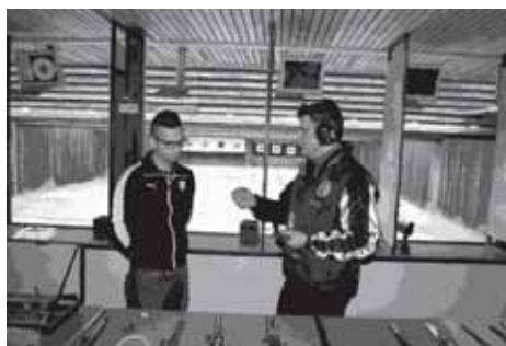
...es gern und fachkundig den Interessierten erläutert hat.

Alle Helfer der Schützengesellschaft haben sich richtig ins Zeug gelegt. Vielleicht ist das aus den Fotos ein bißchen erkennbar.