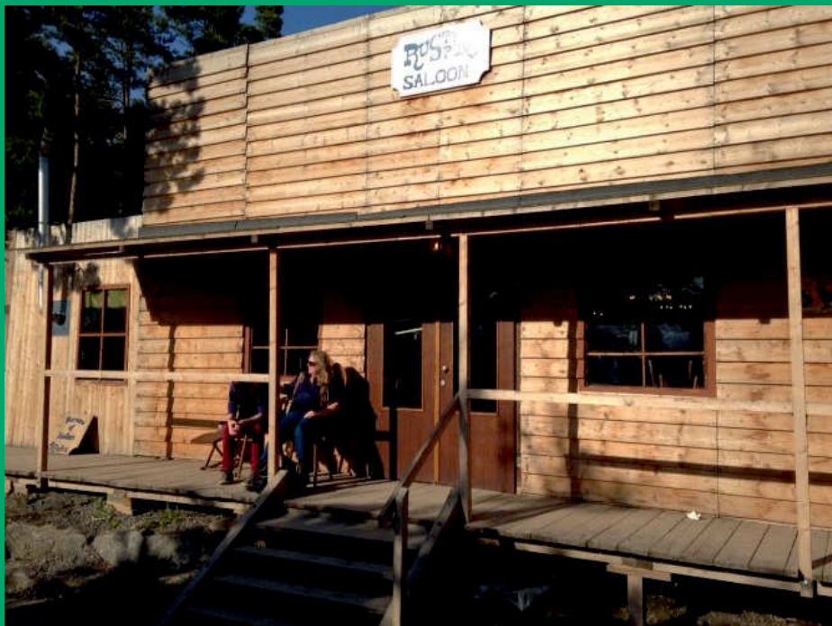
Der Saloon von Sersheim