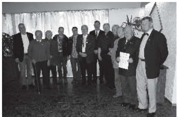
Unten: Unsere langjährigen treuen Mitglieder