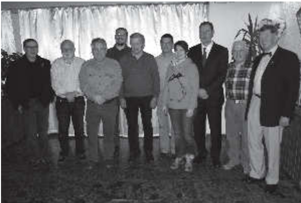
Links: Der gewählte halbe Verwaltungsrat. Die andere Hälfte wird turnusgemäß im nächsten Jahr gewählt.