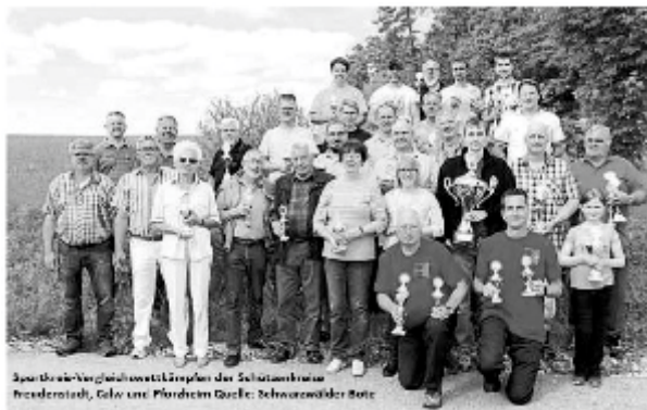
Sportkreis-Vergleichswettkämpfen der Schützenkreise Freudenstadt, Calw und Pforzheim

Jedes Jahr gibt es bei den Sportkreis-Vergleichswettkämpfen der Schützenkreise Freudenstadt, Calw und Pforzheim – diesmal im Schützenhaus der SGi Grüntal/Frutenhof (Gewehr- und Pistolen-disziplinen) und auf dem Vereinsgelände des BSC Freudenstadt (Bogen Recurve).