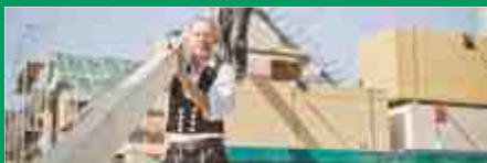
Bauen mit Holz