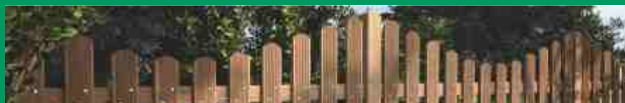
Holz im Garten

Holzland Woll GmbH & Co. KG Wohnlichstr. 10 75179 Pforzheim Industriegebiet Brötzingen Tal